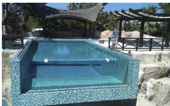
Piscina realizada con bloque AQUARIUM de 70 mm