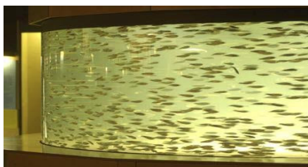
Acuario realizado con bloque AQUARIUM curvado de 40 mm