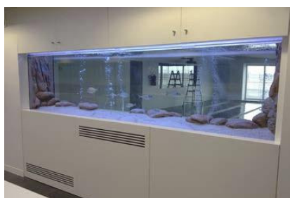
Acuario realizado con bloque AQUARIUM de 25 mm